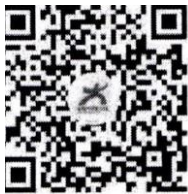
中国大学生在线视频号

1. 录制播出以“千万师生同上一堂国家安全教育课”为主题的公开课。4月14日15时，通过中国大学生在线视频号、微博、B站等直播平台及中国大学生在线官网 dxs.moe.gov.cn 发布，请组织学生错峰观看学习。（中国大学生在线联系人及电话：张洪涛，010-58582344）