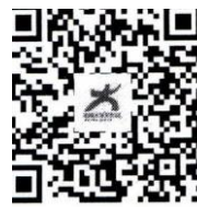
中国大学生在线B站