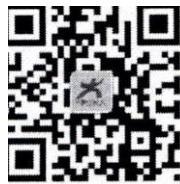
中国大学生在线微博